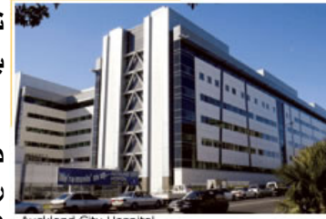
Auckland City Hospital

اگر شما شهروند یا مقیم دائمی نیوزیلند هستید درمان شما در بیمارستان مجانی خواهد بود.