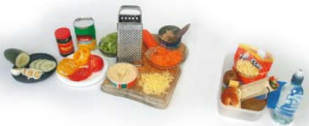
Noiya bóraiya hoo.