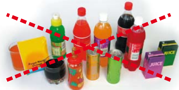
Córbot iín ót becábicí siní asé. Ín óttu basi bélla kucíc goró.