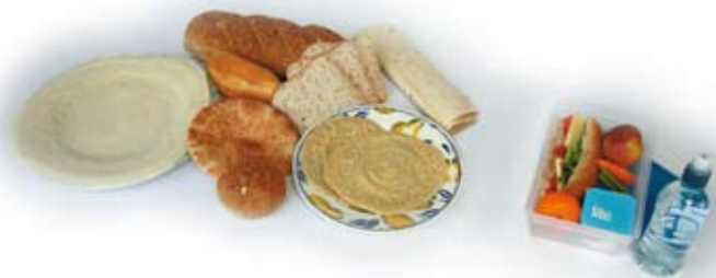
Ho-ekkisím ór ruthi hoo.