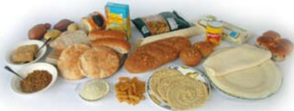
Kessú ruthi arde giñyo nóile gusso ola torhari