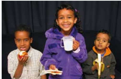
Fuain dóre sehéti nasta ókkol do, hána ókkol ór mazé mazé.