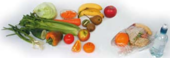
Fottí dín gula arde torhari rakó!