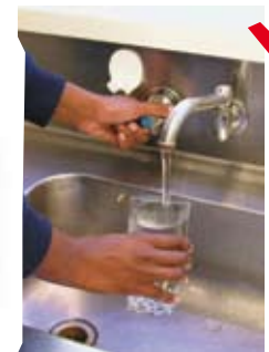
Sehét óla córbot.