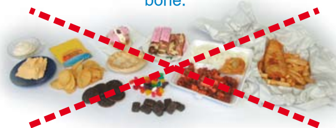
Hána iín ót becábicí soróf, siní arde nun asé. Ín óttu baso nóile atíkká útikká hoo.