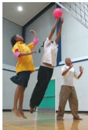
Fottí dín lorasorat táko.