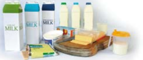
Kessú du arde dut loi bana dé ciz ókkol