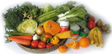
Becábicí ronginna torhari arde gula-gala