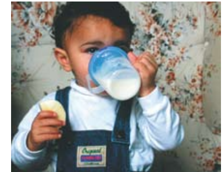
Dut nóile faní fuain dólla bicí gom.