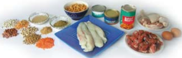
Hom gorí gusso (mesál: kurá, mas, sóol) nóile gussor zagat (mesál: dhail, fúaná dana).