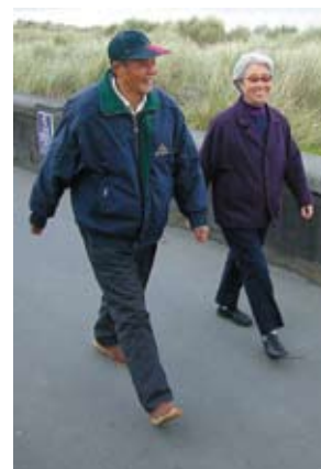
...ar tuáñr górr-ola ré diabétík óttu basai raké, kolóf ór biaram ar oinno ocúk ók- kol óttu.